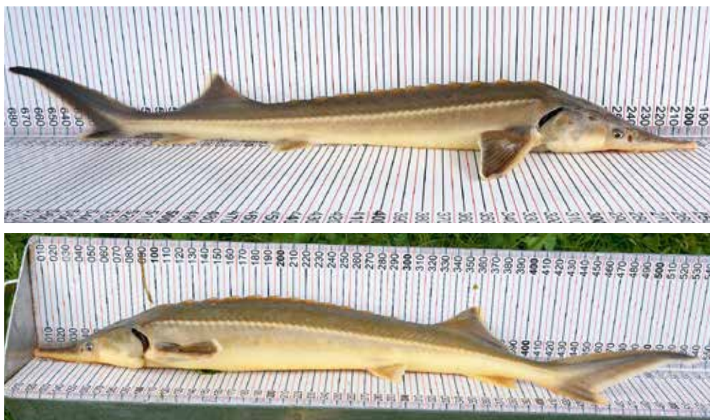
Abb.2: Individualmarkierter Sterlet; oben Erstfang am 10.6.2013 (475 mm); unten Zweitfang 11.10.2013 (530 mm).

Aus diesen Gründen sollte aus Sicht der Autoren derzeit nicht nur auf Besatz von allochthonen Störarten, sondern auch auf Besatz von Sterlets im Nahbereich der erhaltenen Population in der Oberen Donau verzichtet werden, um diesen letzten reproduzierenden Sterletbestand nicht zu gefährden. Sollten Ex-Situ-Maßnahmen, wie Besatz zur Stützung notwendig werden, sollte auf Mutterfische aus dem lokalen Bestand zurückgegriffen werden, sofern sich dieser als groß genug herausstellt. Die Haltung bzw. der Verkauf (Aquakultur, Gartenteiche, Aquaristik etc.) von allochthonen Arten und Genotypen sollte aus fachlicher Sicht im Donaueinzugsgebiet äußerst streng eingeschränkt und kontrolliert werden. Der Besatz sollte in hochwassergefährdeten Wasserkörpern gänzlich verboten werden, weil nicht verhindert werden kann, dass Tiere in die freie Wildbahn gelangen.